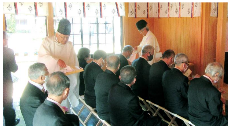
御札・お守り授与 (9:45)