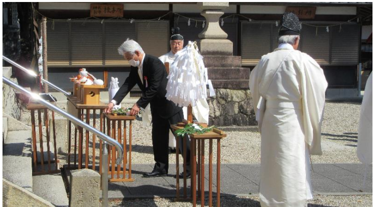
還暦会男性代表 玉串奉奠