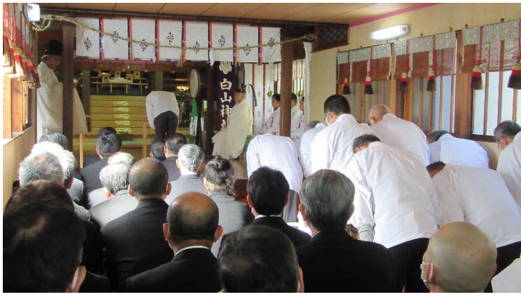
神社代表 玉串奉奠