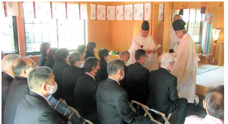
御札・お守り授与 (12:49)