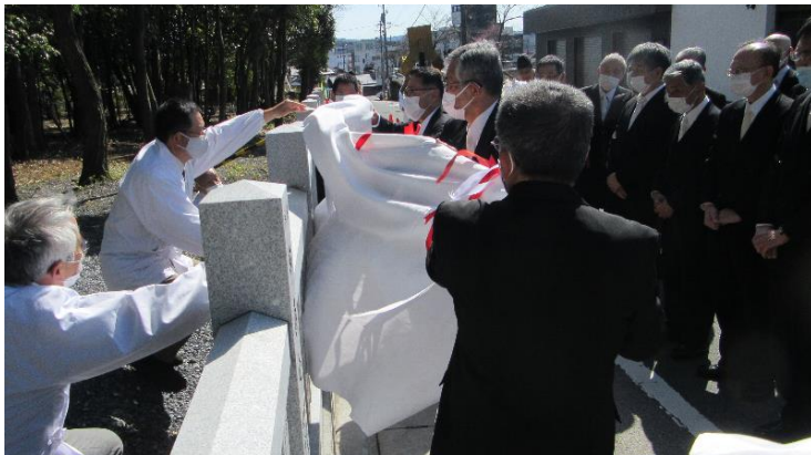
修祓の後 除幕 (13:32)