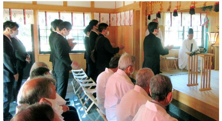
厄年会代表 玉串奉奠