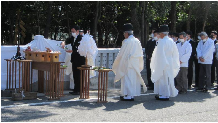
厄年会代表 玉串奉奠