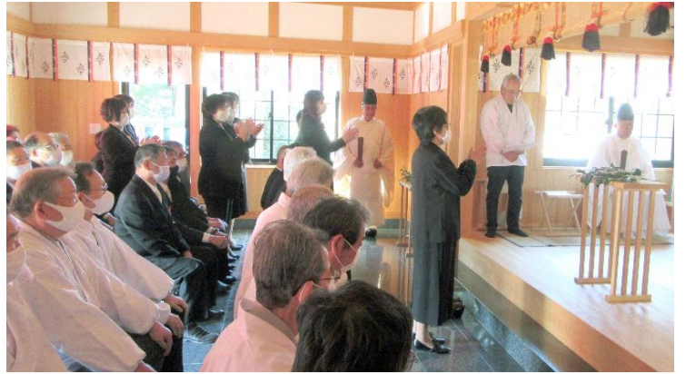
還暦会女性代表 玉串奉奠