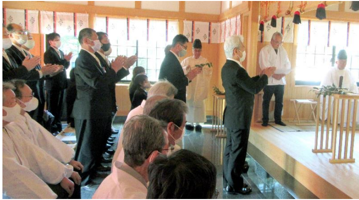
還暦会男性代表 玉串奉奠