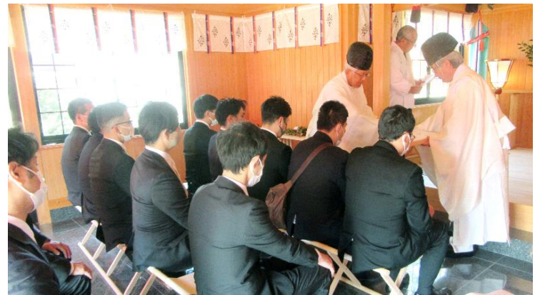
御札・お守り授与 (10:25)