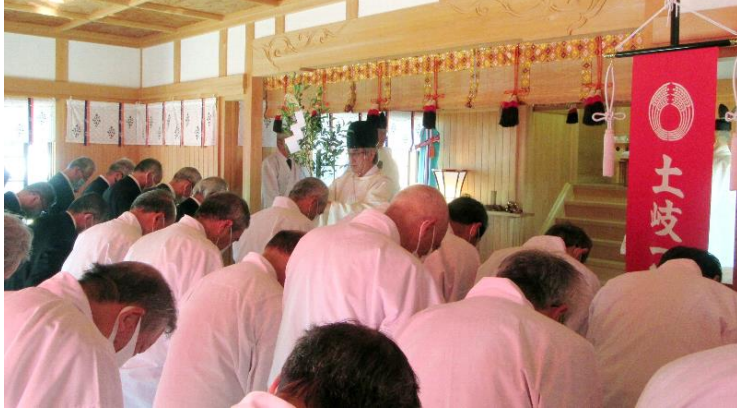
修 祓 (9:21)