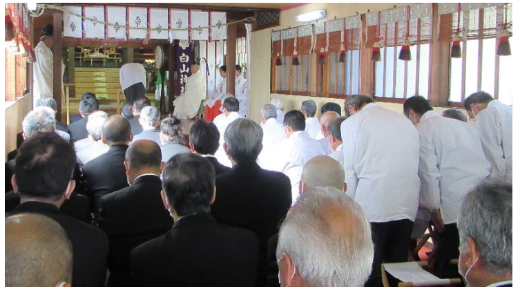
神社顧問代表 玉串奉奠