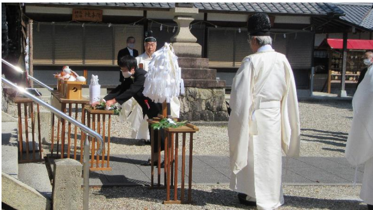
還暦会女性代表 玉串奉奠