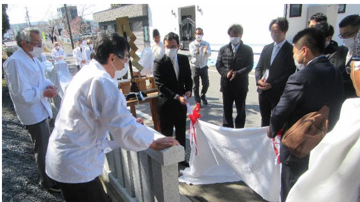
修祓の後 除幕 (10:40)