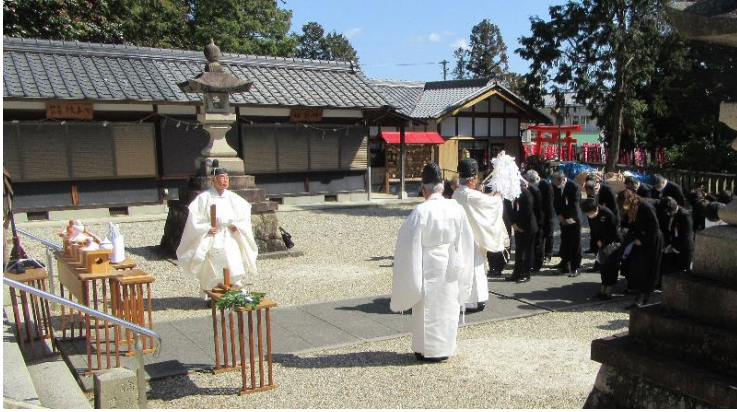
修 祓 (12:59)