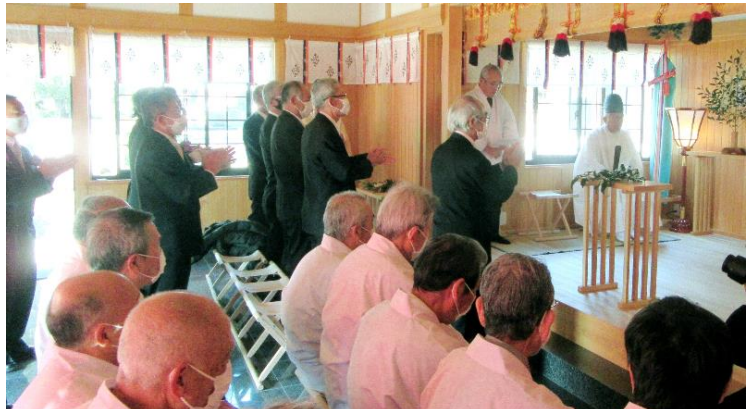
古希会代表 玉串奉奠