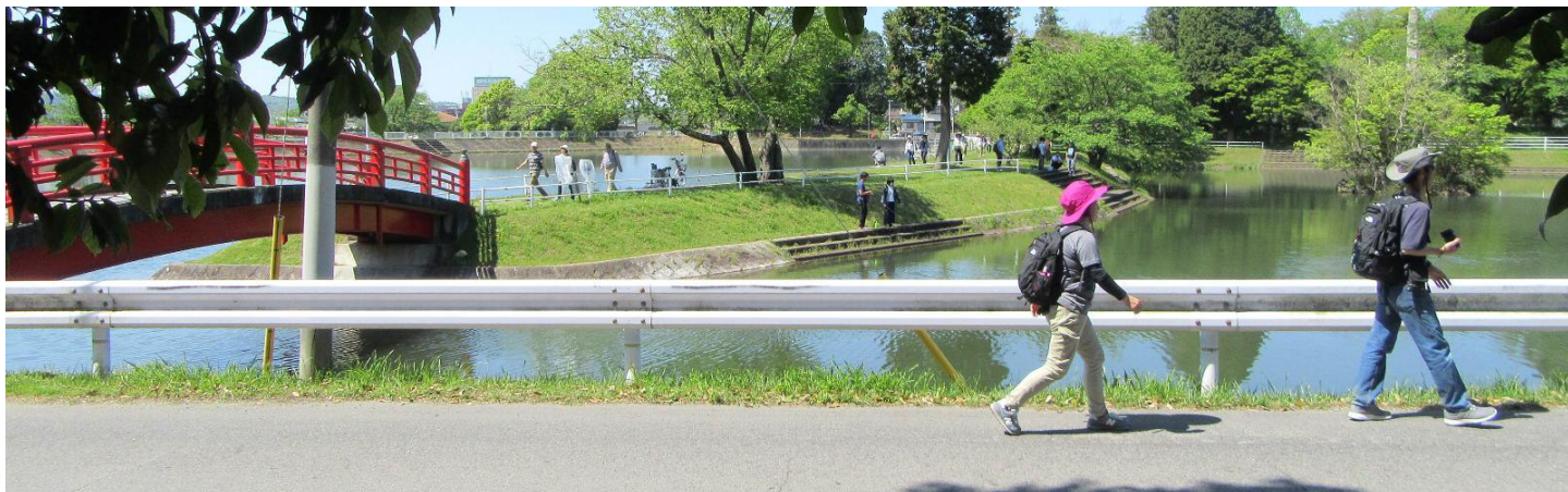
仲森池を通過して白山神社へ さわやかです (10:07)

暖かく晴天の中、JR東海主催の「さわやかウォーキング」が開催されました。大富白山神社がルートに組み込まれたため、神社関係者によるお茶の接待が行われました。