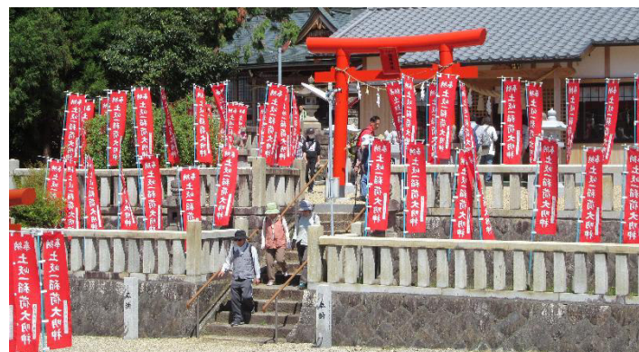
土岐一稻荷神社も参拝