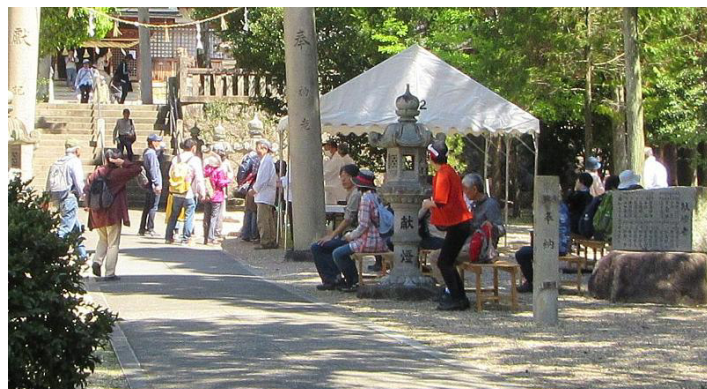
白山神社の参拝前に休憩