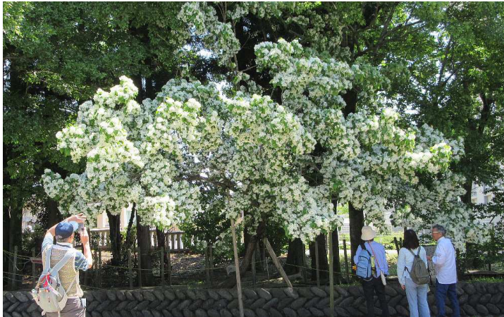
ヒトツバタゴが満開です

J R さわやかウォーキングがヒトツバタゴ(一ツ葉たご)の白い花の下で行われました。白山神社もコースに入っているため、1500 人分のお茶を振舞うため神社関係者が総出で対応しました。