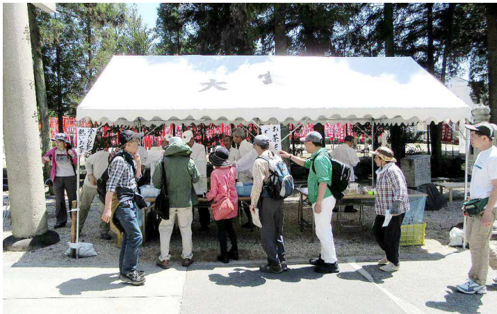
お茶を振舞っています