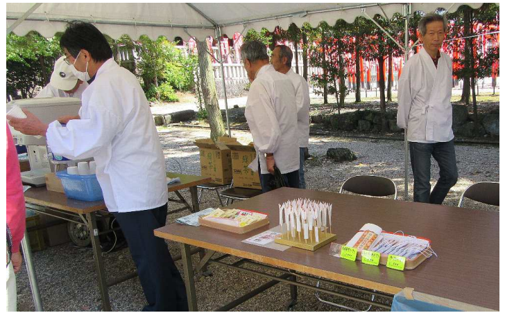
お守りなどを販売