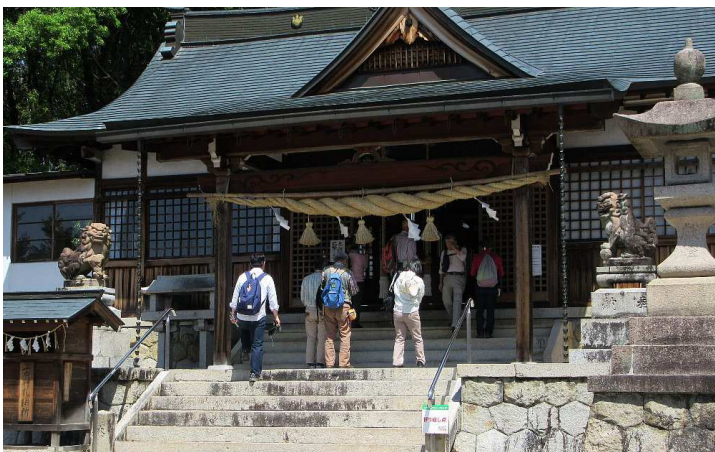
参拝 こちらも手すりが新設されました