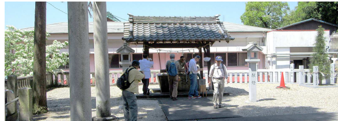
参拝前に手水で身を清める すばらしい青空です