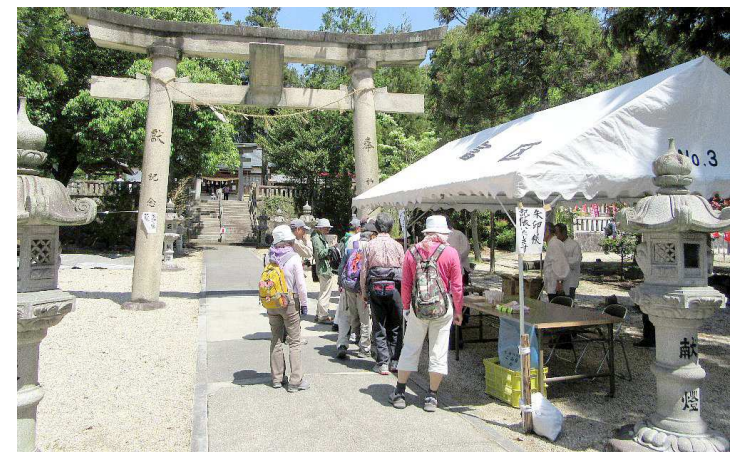
参拝の後休憩「朱印帳 記帳いたします」の表示があります