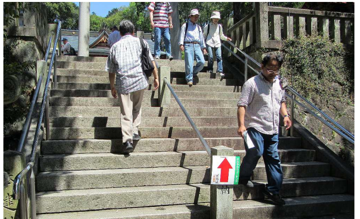
新設された手すりが利用されています